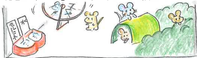
A: 16匹一緒。エサ、遊び場、隠れるところがある環境

32匹のネズミを16匹ずつ、2つの環境におき、モルヒネ入りの水と普通の水を与えました。