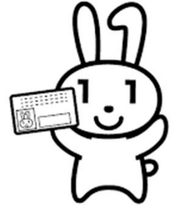
マイナンバーキャラクター マイナちゃん